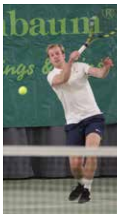
Botic van de Zandschulp